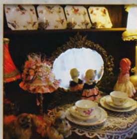
ハート オブ ドール