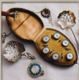
三稜草アンティークス