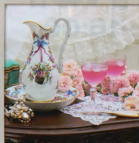
アンティークス ヴィオレッタ