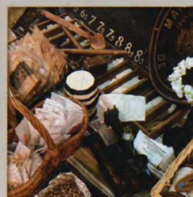
BLEU CURACAO FRANCE